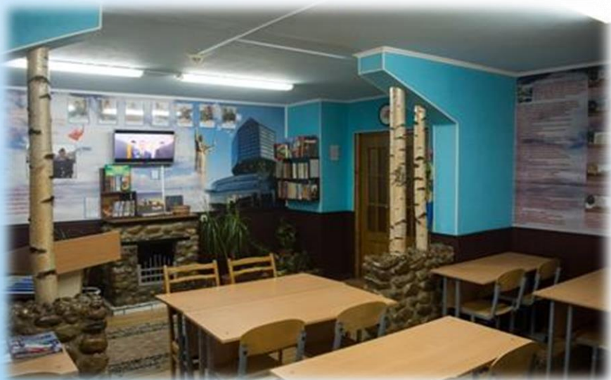
КОМНАТА ДОСУГА И ИНФОРМИРОВАНИЯ