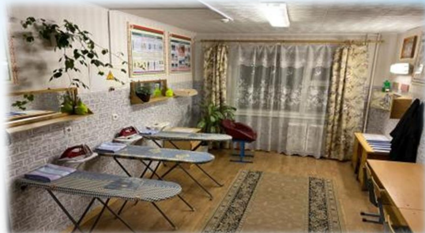
КОМНАТА БЫТОВОГО ОБСЛУЖИВАНИЯ